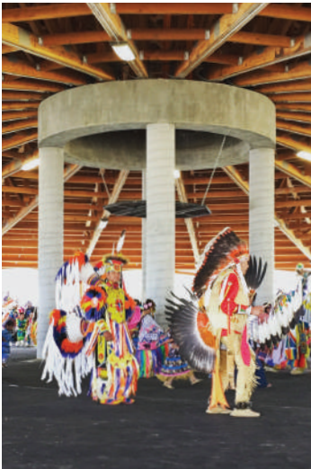
写真：エルモで開催されるスタンディング・アロー・パウワウ

人類学と考古学を学んだ セーリッシュ族 と クーテナイ族 のガイドがいる モンタナ・ジャーニーズ（Montana Journeys） と共に フラットヘッド居住区 をツアーしましょう。鞍をつけた馬に乗って探検又はボートに乗ってフラットヘッド湖の ワイルド・ホース・アイランド州立公園（Wild Horse Island State Park） を観光しましょう。地元では「世界の背骨」として知られているグレイシャー国立公園へは、 サン・ツアーズ（Sun Tours） のガイドツアーでどうぞ。このネイティブ・アメリカン所有のツアー会社は、イースト・グレイシャー（East Glacier）にあります。知識豊かなブラックフィート族のガイドが、土地や国立公園に対する歴史的・文化的な結び付きについての話を含めてガイドします。